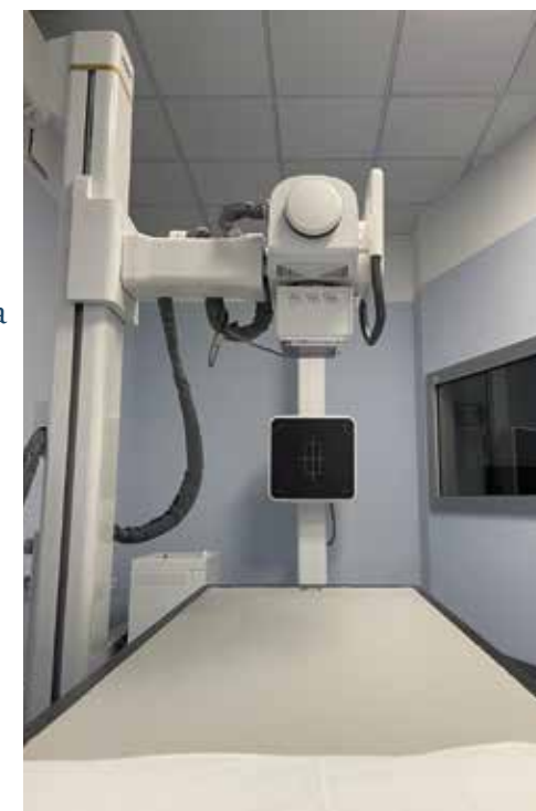
Tavola raggi x