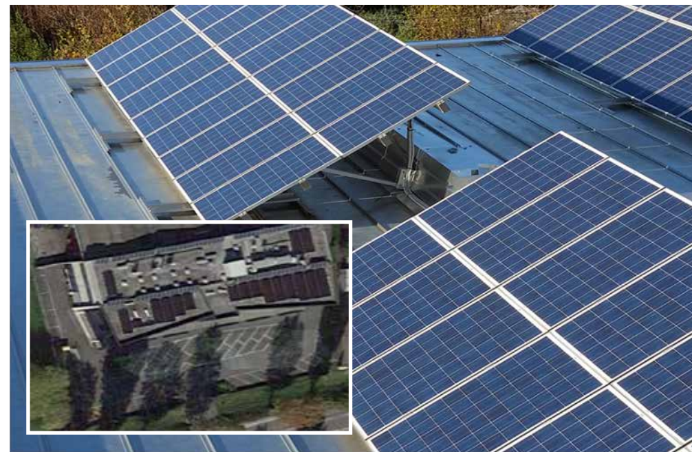
La struttura è stata costruita nel rispetto dell'ambiente con particolare attenzione al risparmio energetico in autonomia grazie al sistema a pannelli fotovoltaici installato sul tetto.

Blue Medical Center opera inoltre all'interno della Rete Sanitaria Regionale come centro autorizzato e accreditato secondo la Legge Regionale n. 22 del 2002.